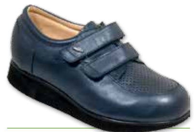
ALFA Velcro Forato Donna