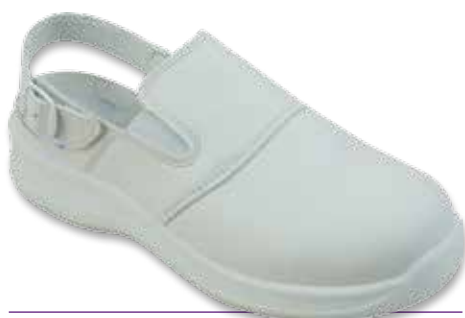
SABOT SB-A-E-FO-SRC P con laccio posteriore