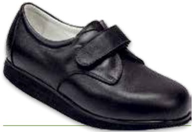
ZETA Velcro Donna P

I modelli contrassegnati con la lettera P sono "pronto magazzino" per la stagione AI 2016/2017 dal 15/10/16 al 31/01/17