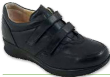
ERNESTO Velcro Diab. Uomo