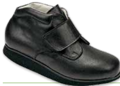
OMEGA Velcro Donna

Cod. 133100 01 12 Pelle Nero Fodera comfort microfibra