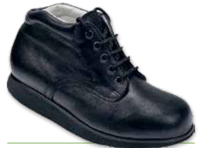
OMEGA Lacci Donna