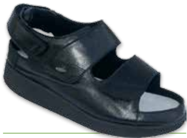
ECO1 Donna P

Cod. 133352 02 38 Nabuk Pistacchio Realizzabile anche FORATO