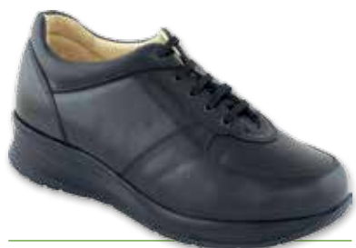
ERNESTO Diab. Uomo P

I modelli contrassegnati con la lettera P sono "pronto magazzino" per la stagione AI 2016/2017 dal 15/10/16 al 31/01/17