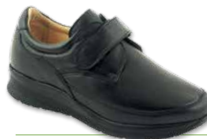
BIOMECC 1 Uomo P

Cod. 121300 90 12 Nappa / Incas Nero Automodellante per deformità articolari