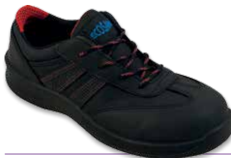
SCARPA LEADER S3-SRC P