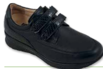
BIOMECC 1 Donna P

Cod. 123B01 56 04 Naplak / Camoscio T. di moro