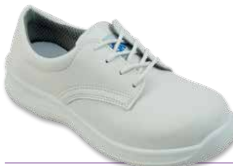
SCARPA ALLACCIATA S2-SRC P