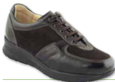
DAFNE Diab. Donna P

Cod. 123B31 56 04 Naplak / Camoscio T. di moro