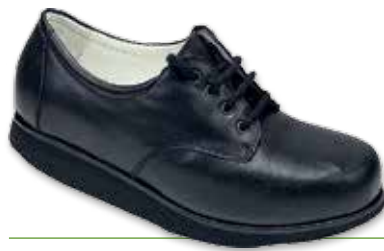
ZETA Lacci Donna