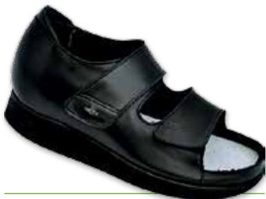
ECO2 Donna P

Cod. 133101 01 12 Pelle Nero Fodera comfort microfibra