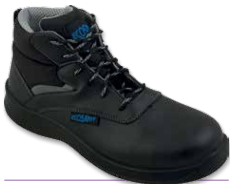
SCARPONCINO LEADER S3-SRC P

I modelli contrassegnati con la lettera P sono "pronto magazzino" per la stagione AI 2016/2017 dal 15/10/16 al 31/01/17