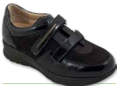
DAFNE Velcro Diab. Donna P

I modelli contrassegnati con la lettera P sono "pronto magazzino" per la stagione AI 2016/2017 dal 15/10/16 al 31/01/17