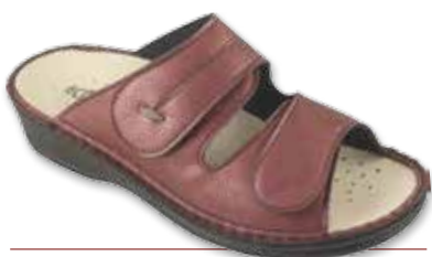
CAMILLA Winter P

I modelli contrassegnati con la lettera P sono "pronto magazzino" per la stagione AI 2016/2017 fino ad esaurimento