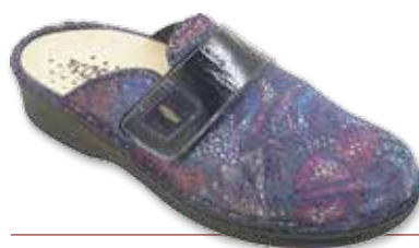
NOALE Winter P

Cod. 113257W 709 12 Butterfly / Naplak Nero