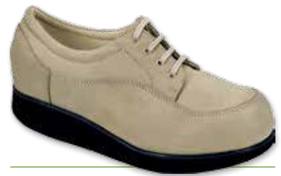
ALFA Lacci Donna

Cod. 133352 02 38 Nabuk Pistacchio Realizzabile anche FORATO